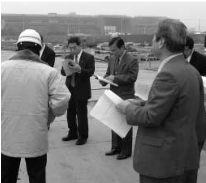
仮称 小針北小学校建設地を視察（企画総務）

A まだ決まらず、たわけではなく、場所の問題、それから業者選定のことも含め県と話し合っている。