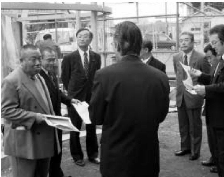
志久駅前トイレ工事を視察（建設産業）

A 維持管理費にどれくらい まわせるのか。 バラ園の維 持管理費が、 年間約250 0万円かかっている。初 年度については、有料化 にかかるランニングコス トもあるもので、約700万円 程維持管理にまわすこと ができる。