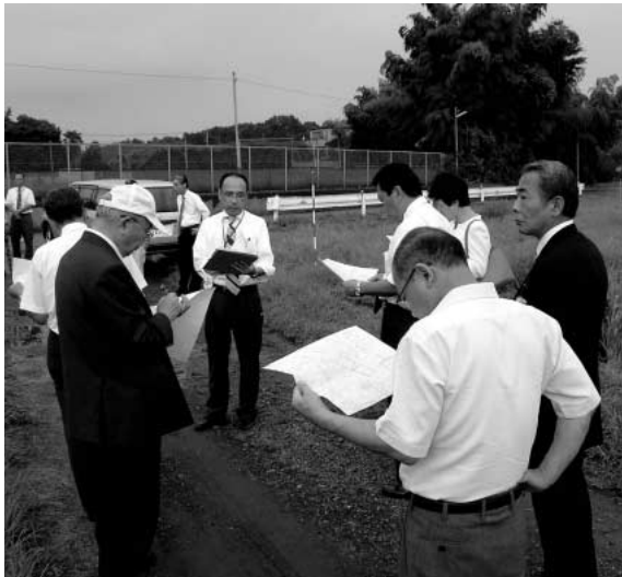
町道歩道整備工事箇所を視察

答 工事標識を設置し、バリケード、点滅灯で車両及び通行の安全を図る。また、作業中については、交通整備員等を適正に配置し、安全確保を図る。