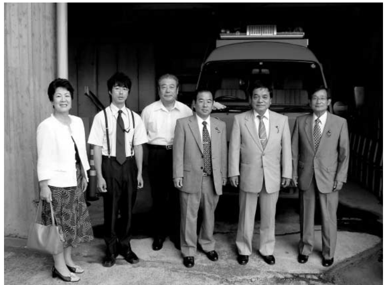
更新が予定されている消防車輜

問 消防ポンプ車は、緊急時しか使用しないので、ほとんど乗ってないと思うが、走行距離は何キロか。