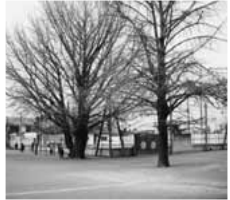
伐採予定の銀杏の木（小針小学校）

問 所が必要となる。万一の倒木事故や校庭活動の影響を最小限とするため、且つ常に安心安全が保てるようやむを得ず伐採することとした。伐採によって校庭での活動が広範囲に出来る利点、落ち葉等の影響が近隣住宅、学校施設管理に及ばないよう配慮したい。 答 ベンチ、挿木等、何かの方法を検討したい。