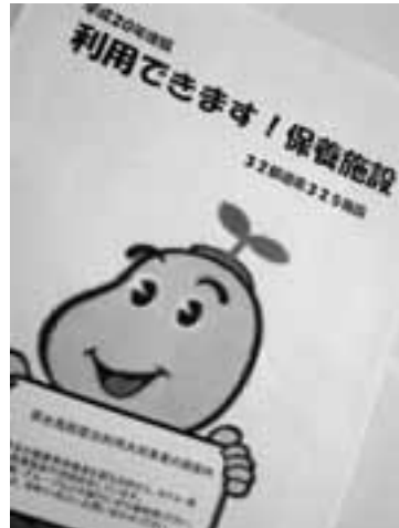
保養施設のパンフレット・75歳以上の方利用

答 家庭保育室への助成を厚くし、児童受け入れ枠の拡大を図りたい。民間認可保育所の新規参入も視野に入れ、町単独の財政支援策を検討したい。