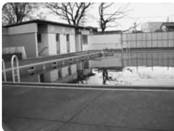
現在の小針小学校のプール