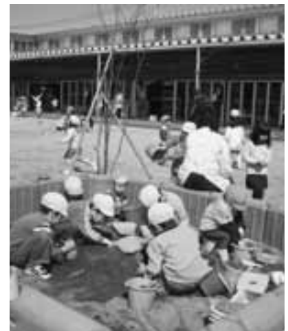
すくすく育て 子どもたち