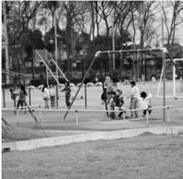
元気に遊ぶ子どもたち