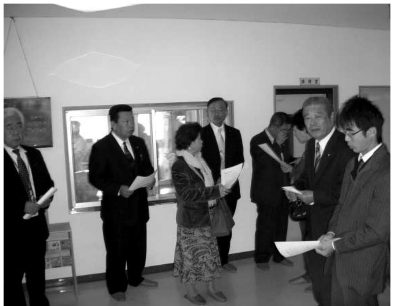
南保育所調理室を視察

答 食材まで委託してしまうと、質を下げてもうけに入れてしまう懸念があるので、町内業者から材料を供給していただいている。調理の委託については特に問題はないと考えている。