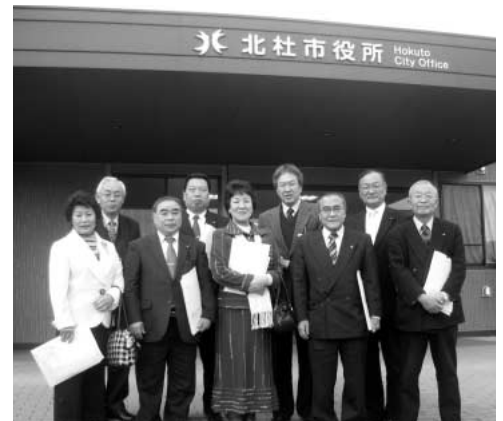
山梨県北杜市役所前にて

今回の研修で、若者に町として支援策の必要性と、新規就農者が増える可能性があることを強く感じさせられました。