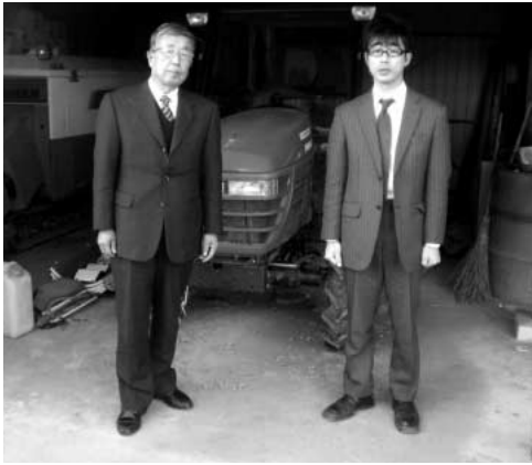
大利根町で貸し出している農機具