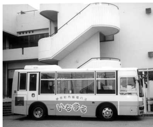
町内循環バス「いなまる」