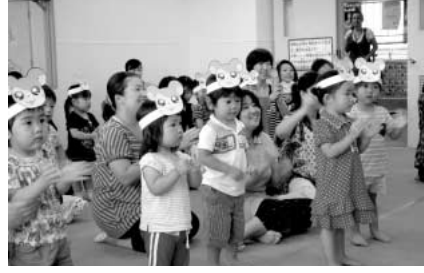
児童館行事（お遊び広場）