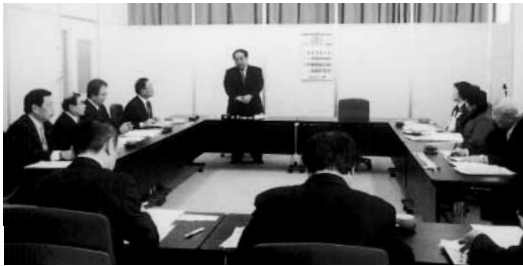
視察テーマについて説明を受ける