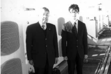
広沢小学校屋上のエアコンの前で

設置に至った経緯は、前市長が教育環境の充実を最優先課題として位置づけていたことと、地球温暖化やヒートアイランド現象により教室の温度が30度を超えている状況のなかで、議会や保護