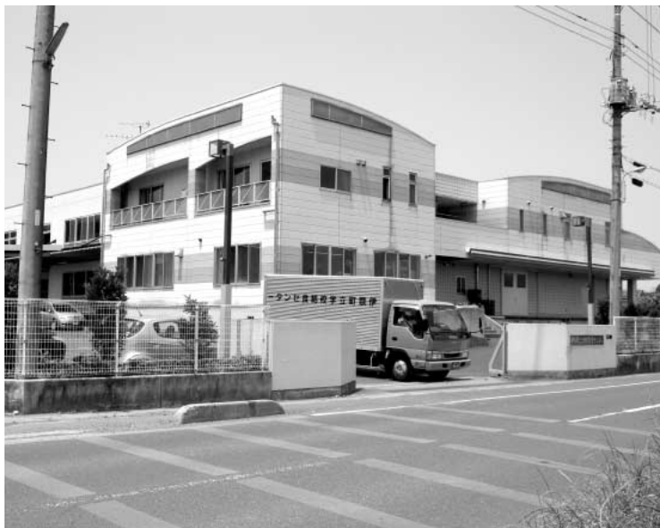
給食の放射能測定を始めた給食センター