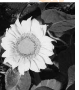
表紙の写真ってなに?

事案について、提出者の説明があった後、討論、表決に入る前に、疑義を質問するために行う発言のこと。