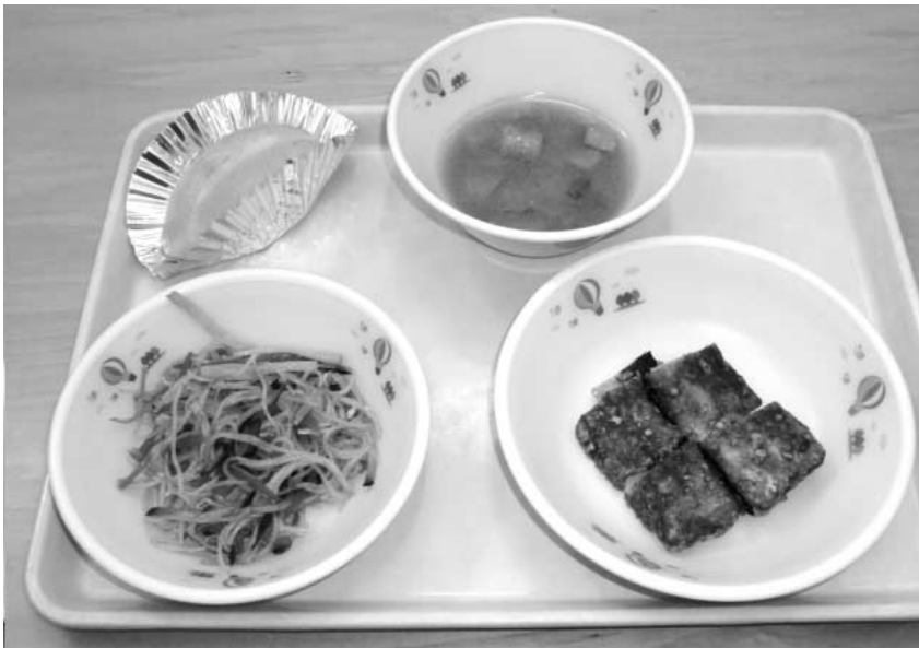
すべての町立保育所で完全給食を実施（平成25年度から）