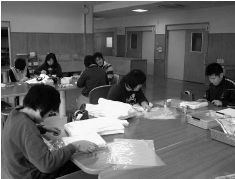
まつぱっくりでの作業風景(心身障害者デイケア施設)