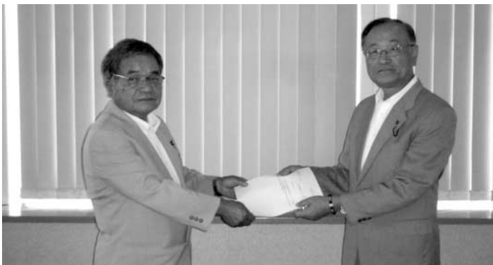
諮問書の受け渡し風景

平成25年4月1日に施行された、伊奈町議会基本条例の運用方法について検討するように、議長から議会運営委員会に諮問されました。いよいよ本格的に、議会基本条例が動きだします。