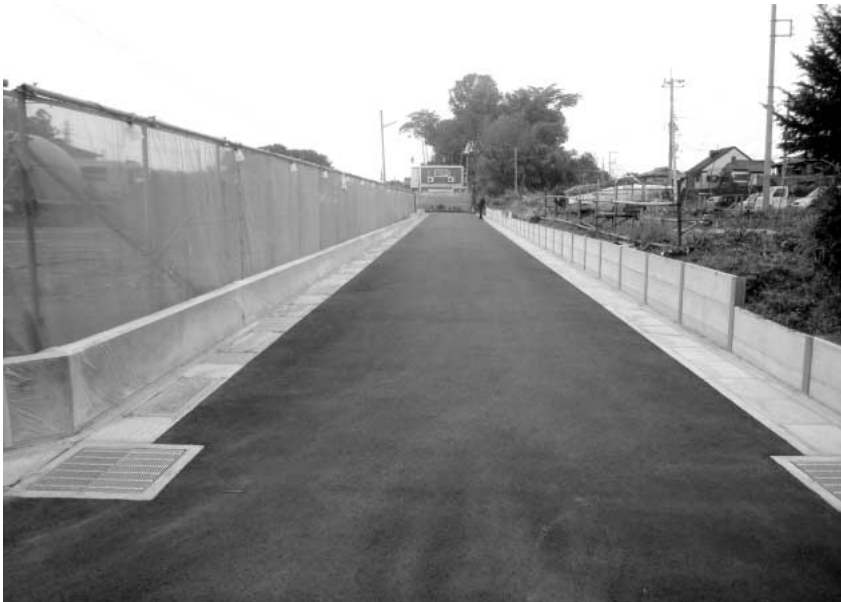
新しく認定された町道