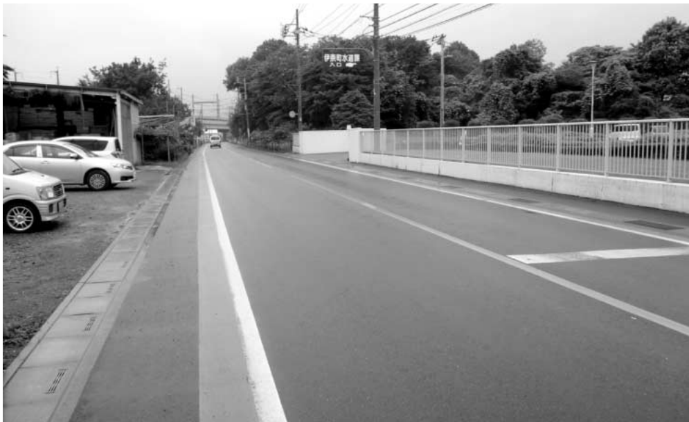
舗装調査をする町道

6月定例会は、6月4日から6月18日までの15日間の会期で開かれ、町長より提出された7議案が、全て原案どおり可決されました。また、一般質問では8人の議員が町政に対し質問しました。