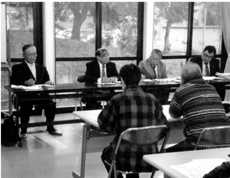
「新宿集会所」 たくさんのご意見をいただきました