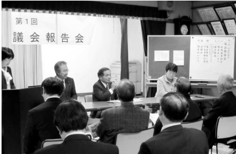
「小貝戸集会所」 議員の説明に、皆さん 真剣に聞き入っていました