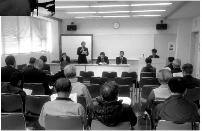
「ゆめくる」 活発な意見が出されました