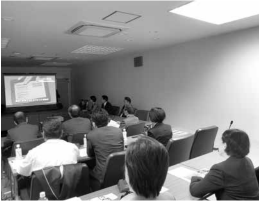
先進的な取り組みをしている箱根町からたくさんのヒントを得ました

逗子市議会は平成25年度より議会運営にタブレット端末を活用し、ペーパーレス議会の推進と業務の効率化に取組み、議会活動の質の向上と運営