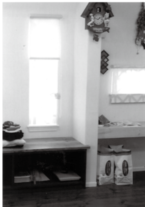
グループホーム1階の共用室内