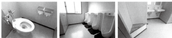
女子トイレブース内