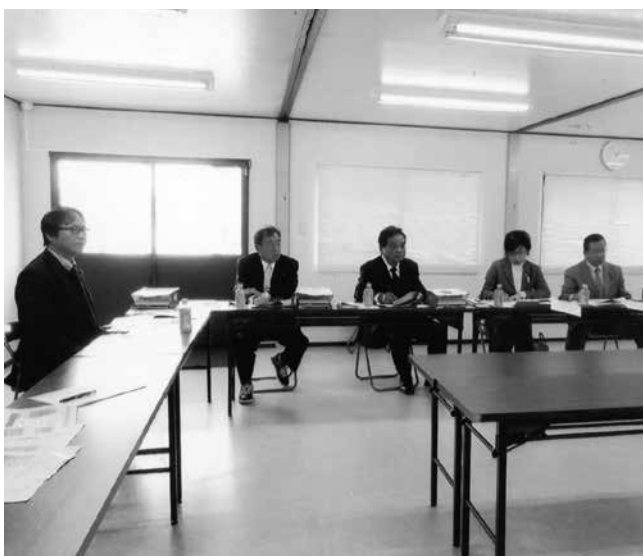
福祉避難所についての説明を受ける

宮城県亘理町は、人口34120人の町です。亘理町は太平洋に面しており、平成23年3月11日の東日本大震災では、約300人が亡くなり、住宅被害は約6200棟、被害総額は約3350億円でした。 福祉避難所とは、高齢者・障がい者・妊産婦・病者等、一般的な避難所では生活に支障をきたす人たちのために、何らかの特別な配慮がされた避難所です。東日本大震災が発生した時、亘理町は町内の福祉避難所2カ所に、要援護者を受け入れられました。町内の福祉避難所8カ所の内訳は、特別養護老人ホーム2カ所、グループホーム2カ所、デイサービスセンター4カ所です。費用については、全額災害救助費で国へ申請しました。福祉避難所運営における反省点は、要援護者の情報をもっと把握しておけば良かった、ということ 亘理町が大きな地震に襲われた時、福祉避難所をどう活用すべきか、亘理町の経験を通して、学ぶことができました。