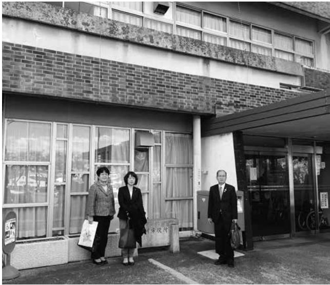
子育てに関する親の負担を軽減する事業等幅広い子育て支援を展開している渋川市庁舎前にて

渋川市では、子供達の健やかな成長のため「渋川市こども夢基金」条例を制定。財源は寄付金および民間事業者のソーラー事業から生じる借地料等です。保護者の就労形態に適應した公立保育所休日保育事業や給食費の一部公費負担に加え、第3子以降は完全無料化する等魅力的な事業が展開されています。 伊奈町長公約の「日本一子育てしやすい町」を目指し「伊奈町子ども夢基金」を創設すべきです。 「手話言語条例」制定に向けて 三芳町は、平成27年12月に手話言語条例を制定。前年度から「あいサポート運動」を導入し、障がいを理解する啓発運動から始め、サポーター講座を月に3回開催し、3年間で三芳町・富士見市・他市と合わせて延べ3530人が参加しました。手話通訳派遣も富士見市に委託し、聴覚障害者支援事業を推進しています。言語条例に向けても、検討を重ね、基調講演の開催等を経て制定に至りました。 伊奈町も早期制定すべきです。