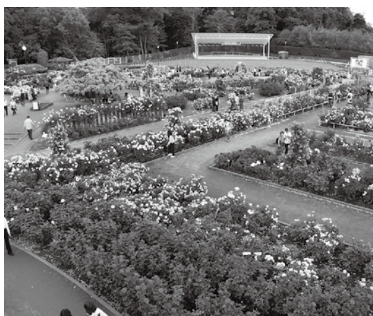
バラ園内に記念植樹花壇が整備され植樹式が行われる