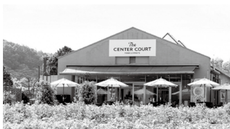
ワールドローズガーデンに訪問

バラ公園や戦国時代の遺跡を市民や観光に役立てている先行事例と伊奈町の誇る忠次公の生い立ちを深く知ることが、目的です。 まずは市内に多くある戦国山城を生かしている愛知県可児市に伺いし、市役所で戦国山城が市民との協力で