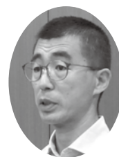
おおさわ じゅん 大沢 淳 議員