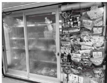
町内を回っている移動販売車の1台。商品を選べる魅力がある上、利用者の見守りも兼ねている。

新ごみ施設付近の整備 原市沼川上の池の上流地域の治水整備は。 上の池整備後に河川改修の計画がある。 道路の整備計画は。 上尾伊奈ごみ広域処理施設へと接道する上尾伊奈線は、施設と並行して整備していく。 防犯情報で町を守る 町内の犯罪状況は。 還付詐欺等の特殊詐欺は令和2年1件が、令和5年は7月までで7件。住宅関連の消費生活相談は今年7月までで7件、うち6件が屋根修理関係である。 防犯、詐欺的営業情報の随時周知を。 防犯情報を町ホームページのトップに掲載改善する。リアルな犯罪情報も上尾警察署に相談し、緊急メール等で配信していく。