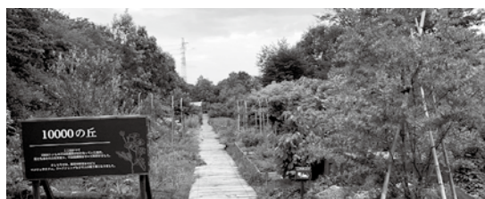
東京ドーム4.5個分の広さの【くぬぎの森】の「10000の丘」。かつて1万トンもの不法投棄の山になっていた場所がハーブガーデンに生まれ変わった