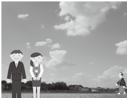
だれをも大切にし だれもが誇れる伊奈町に