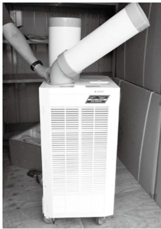
移動できるスポットクーラーは屋外の臨時救護室等でも活用可能。被災者や適切な医療活動のためにも台数を増やす検討も

問 避難所の暑さ対策を早急に。 答 スポットクーラー3台と大型扇風機6台、購入準備を進めている。