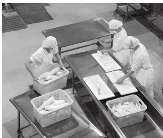
調理中の学校給食センター職員

問 学校給食費管理システムの新規導入が制限されるなど諸般の事情で公会計化移行の時期を再検討しているとのことだが、いつを予定していたのか。