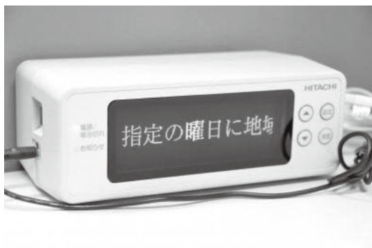
聞こえない人に合理的配慮を 防災無線