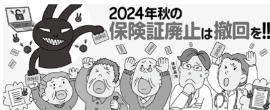
マイナ保険証の利用率がわずか5%なのに、現行の健康保険証を廃止するのは無謀です (全国保険医団体連合会掲載許諾済)

答 底は浸透式で、コンクリートで固められないので、環境に配慮して刈取りをしている。