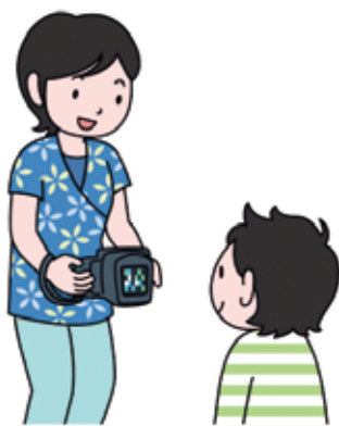
屈折検査のイメージ

屈折検査では、幼児の近視、遠視、乱視といった屈折異常や斜視を発見することができます。