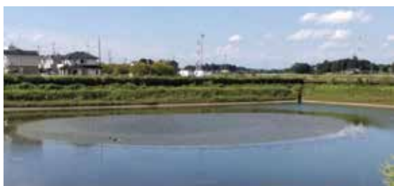
浚渫工事に入る第一調整池