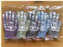
▲ローズちゃんの「エコ手袋」※色は選べません