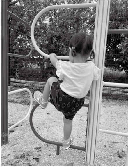
遊具で楽しく遊ぶ3歳児