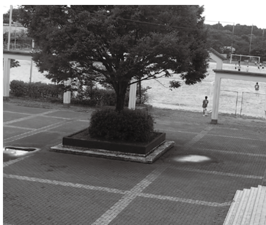
地盤沈下で凸凹のできた前庭（南中学校）