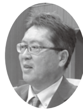
なかじま ゆうた 仲島雄大 議員