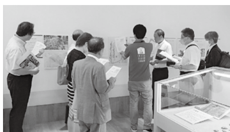
西尾市資料館で学芸員から説明を受ける

外にも、一年中花が楽しめる様子を説明いただきました。 2日目は忠次公の生い立ちを追い、西尾市資料館を訪問しました。