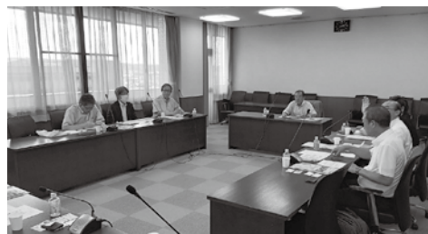
可児市役所で担当者と協議

視察日 令和5年7月10日・11日 視察日 愛知県可児市・西尾市 会 派 新政伊奈・颯政会・日本維新の会