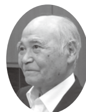
大野 興一 議員 おおの こういち