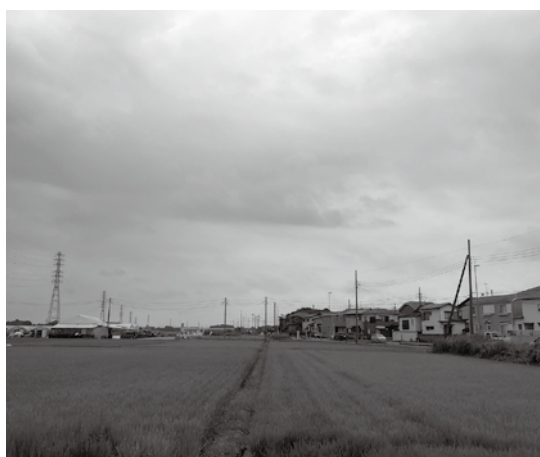
綾瀬川断層が走る伊奈町 町内を走る活断層について、適切な周知が求められる