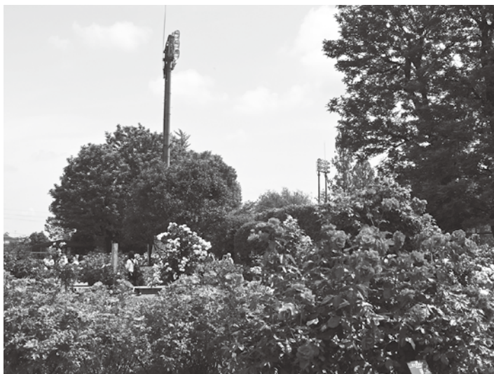
令和6年度に全国ばらサミット開催を待つバラ園