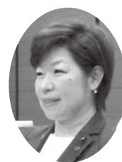
栗原 恵子 議員 くりばら けいこ