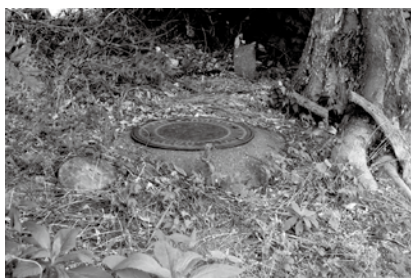
年内に撤去予定の埋設された防火貯水槽