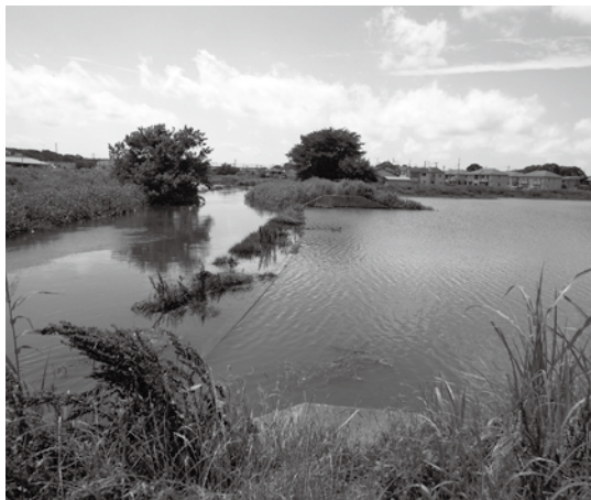
6月2、3日の豪雨の後、満杯となった下の池調節池

答 伊奈中学校9学級と南中学校8学級の合計17学級に1人、小針中学校23学級に1人の配置状況だ。中学校で