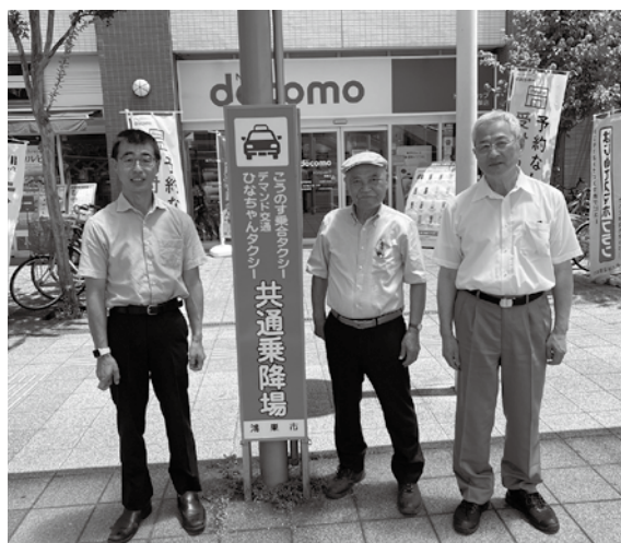
乗り合いタクシーの乗降場で(鴻巣駅前)

鴻巣市は循環バスとデマンド交通を組み合わせて利便性の高い公共交通システムを実現しました。デマンド交通は2種類あり、利用者の満足度はどちらも90%を超えています。 「ひなちゃんタクシー」の利用対象者は、70歳以上や障害を有するなど条件があります。タクシー会社と連絡して利用し、タクシー料金が2000円未満の場合の利用料金は500円です。