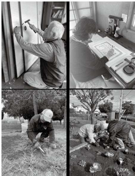
シルバー人材センターのかたの活動

答 共生社会の実現を推進するために必要な認知症に関する正しい知識及び認知症の人に関する正しい理解を深め、同時に認知症の人のみならず家族等に対する支援により、認知症の人及び家族等が地域において安心して日常生活を営むことができる、以上である。