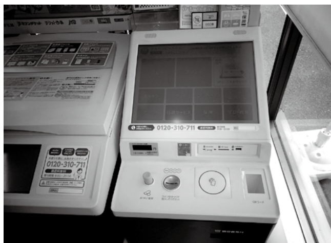
今後、端末機をスマホで利用も可能になるが、リスクや本人による失効手続きが必要になる等、留意も必要